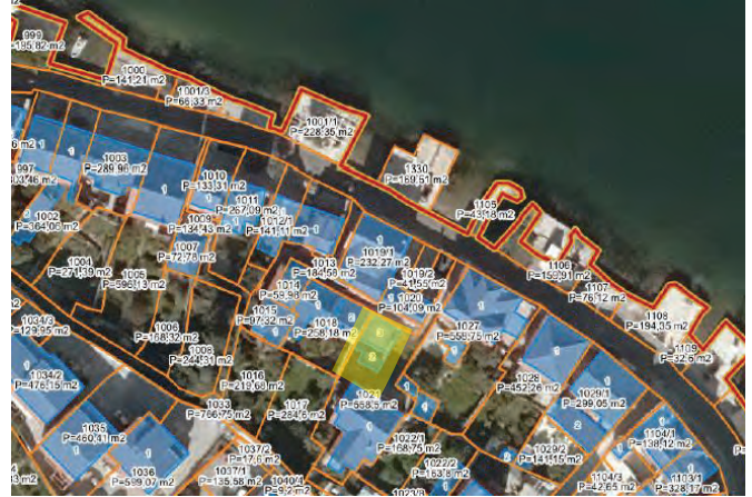
Prikaz katastarskih parcela (GeoPortal Crne Gore)

OPŠTINA-----KOTOR KATASTARSKA OPŠTINA-----KO PRČANJ I POVRŠINA NEKRETNINE-----152 m 2 CIJENA NEKRETNINE U EUR-----NA ZAHTJEV ID BROJ-----ME10242B01001